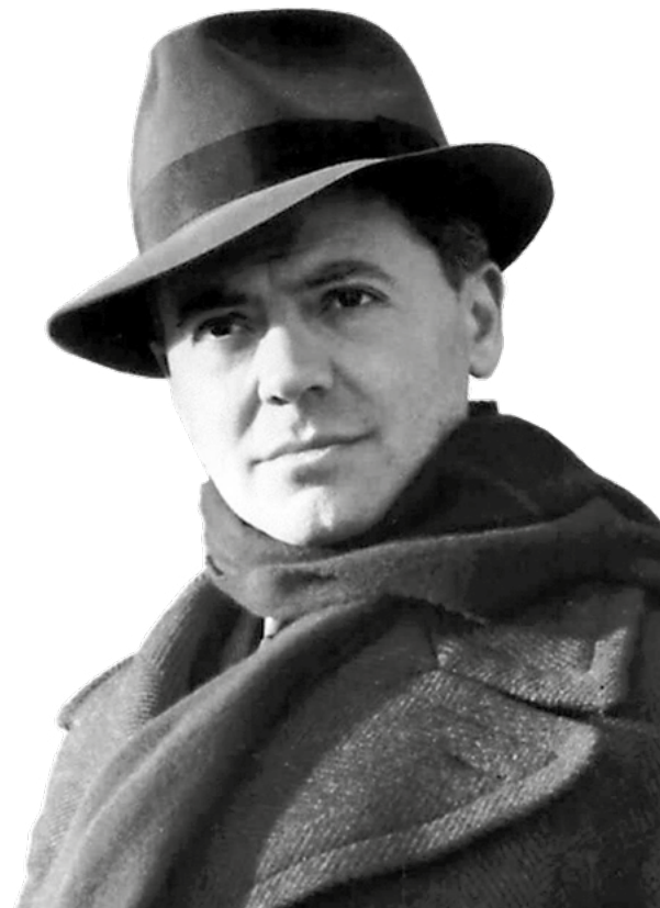
Jean Moulin, 1939/1940

Überall in Europa gab es Frauen und Männer, die den nationalsozialistischen Verbrechen entgegen traten und Widerstand leisteten. Die Orientierung an Menschenrechten, die Wiederherstellung des Rechtsstaats und die Befreiung ihrer Länder vom Nationalsozialismus leiteten ihr Handeln.