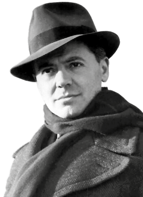
Jean Moulin, 1939/1940

Il s'agit donc de s'interroger sur l'apport d'une approche transnationale de l'histoire de la résistance au nazisme.